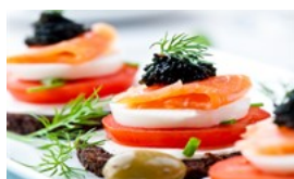
מכללת השף לימודי טבחות וקונדיטוריה בכל הארץ! (לימודים)